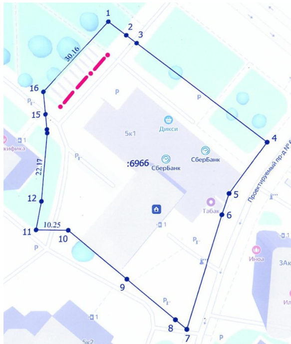
Схема установки двух ограждающих устройств на придомовой территории многоквартирного дома по адресу: г. Москва, Коровинское шоссе, дом 5, корпус 1 в муниципальном округе Западно Дегунино в городе Москве

Приложение к решению Совета депутатов муниципального округа Западно Дегунино в городе Москве от «17» июня 2026 года № 7/44